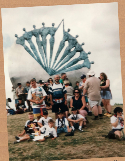
De delegatie 'Scouting Voerendaal' op de Wereld Jamboree 1995.

Als je naar Walibi (of Lowlands..) gaat, let dan goed op het kunstwerk bij de rotonde vlak voor de parkeerplaats.